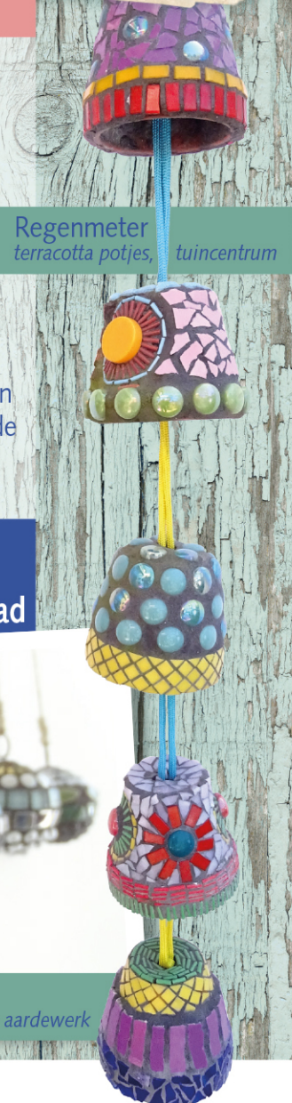
Regenmeter terracotta potjes, tuincentrum