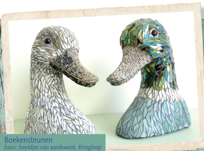
Boekensteunen basis: beeldjes van aardewerk, Kringloop