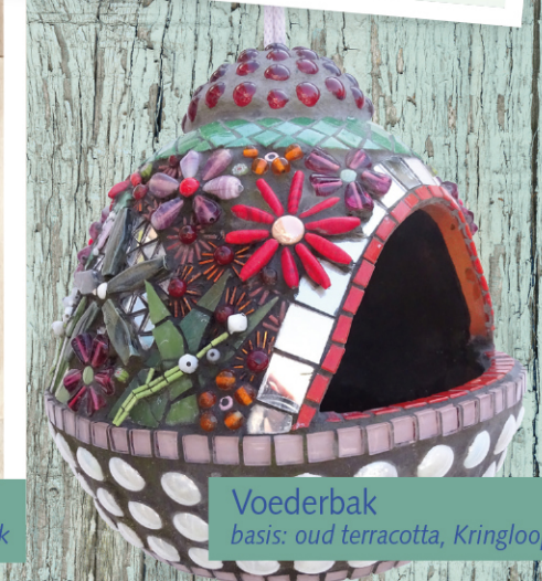
Voederbak basis: oud terracotta, Kringloop