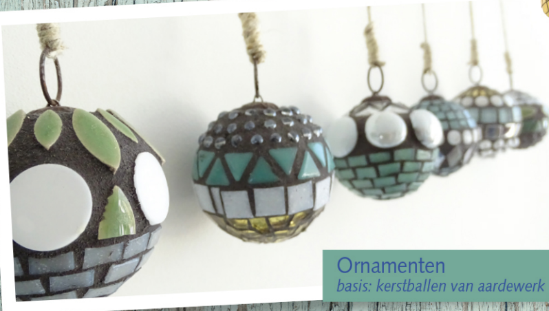
Ornamenten basis: kerstballen van aardewerk

Tip: Kijk op mijn site voor meer bruikbare materialen en lees meer over waar ik veel van mijn materialen koop! https://www.illustratieenzo.nl/en-zo-download