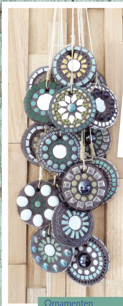
Ornamenten basis: schijfjes van keramiek