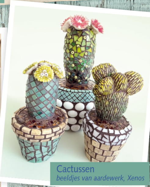
Cactussen beeldjes van aardewerk, Xenos